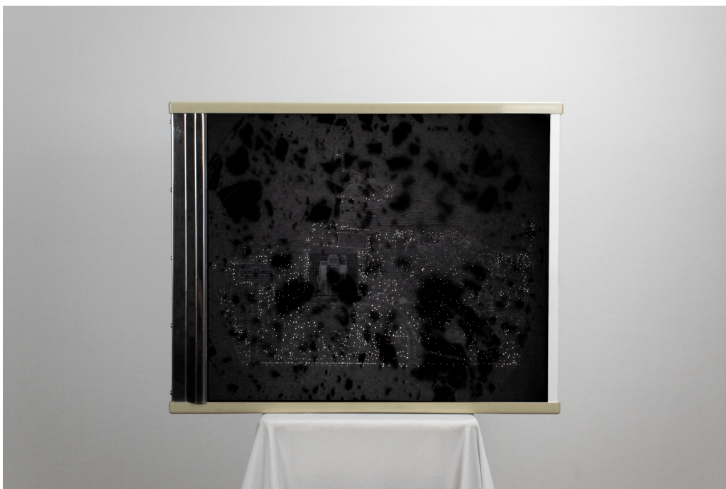
Figura 1. Caio Maurício. Sem Título, 2025.

A materialidade da obra — um negatoscópio, uma lâmina pedogenética impressa em papel vegetal e um mapa do Parque Lage perfurado — constitui um dispositivo de leitura do espaço que é, simultaneamente, leitura do tempo: um conjunto de camadas históricas, geológicas e afetivas que se reorganizam pela luz. Assim, gesto artístico, arqueológico e cartográfico convergem em uma mesma operação de montagem, fazendo com que diferentes estratos de memória se ativem e se recomponham no presente da obra.