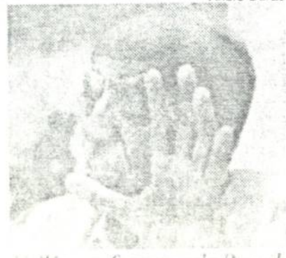
Millôr e o fracasso do Brasil: