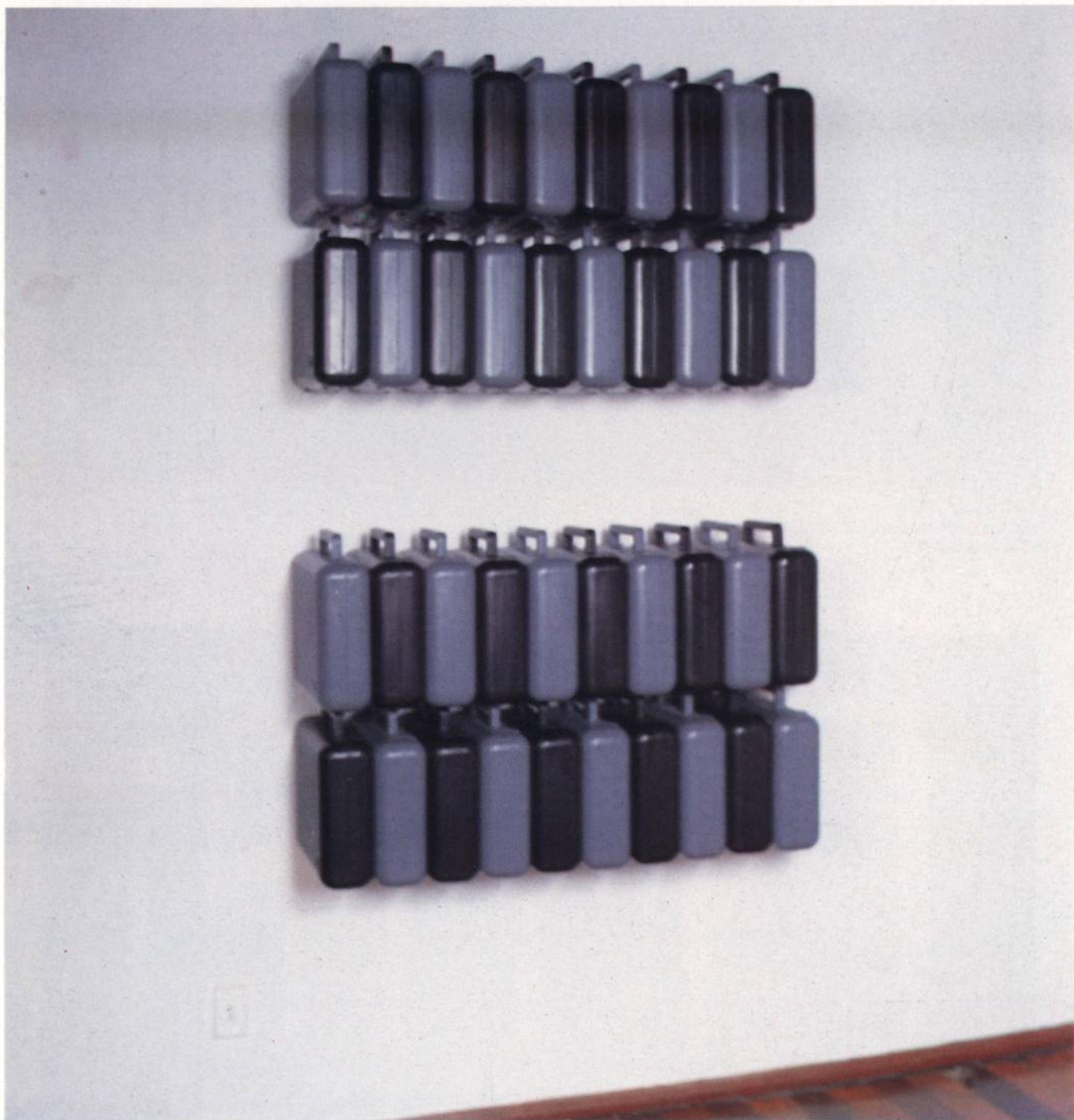
Sem título, 1989 Plástico, ferro 1.11m X 1.70 X 0.40