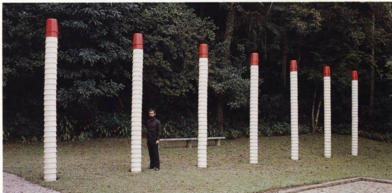
Sem título, 1989 Plástico, ferro, concreto, madeira 17m X 4 X 0,36