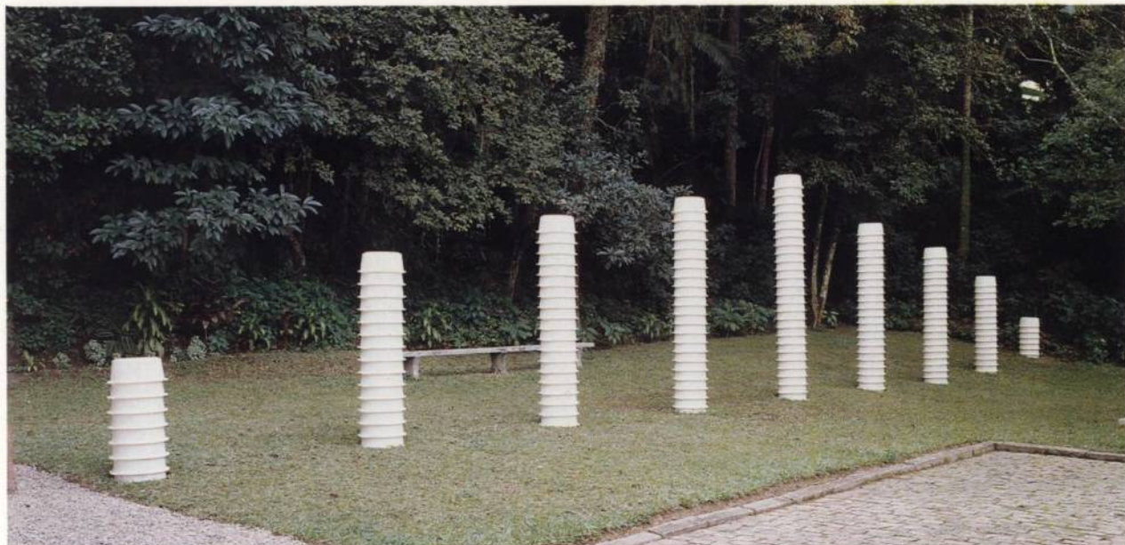
Sem título, 1989 Plástico, ferro, concreto, madeira 21m X 4 X 0,56