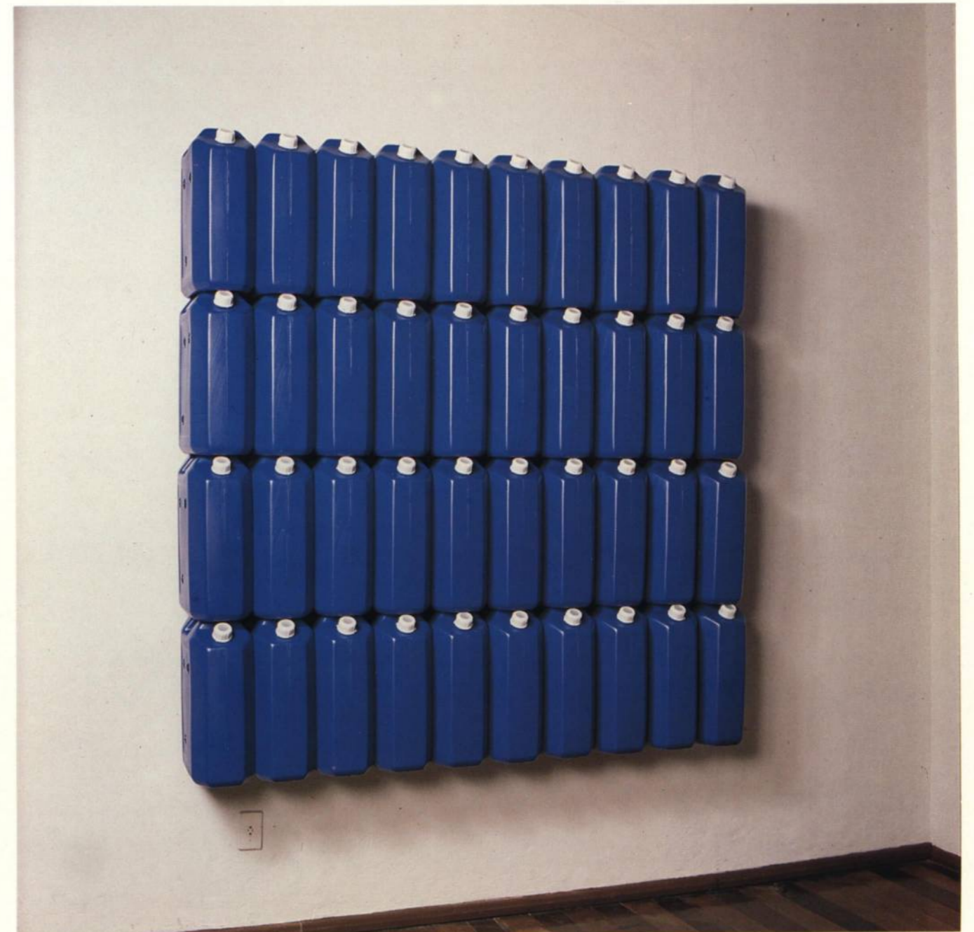
Schwanke Sem título 1989 Plástico, ferro 2.10 x 2.10 x 0.36 m

Rio e São Paulo sempre ditaram normas para o resto do país, esquecendo ou recalando deliberadamente a obra realizada por artistas de outras regiões. No entanto, com sua peculiar imaginação criativa e sua inteligência visual, Schwanke realizou trabalhos que iriam servir de matriz para outros artistas hoje muito mais conhecidos e badalados, como quando ocupou parte do espaço da Galeria Sérgio Milliet com papéis amassados (com "papéis que não deram certo", como ele diria), para citar apenas um exemplo. Sempre bem informado, Schwanke transita com naturalidade por vários ismos contemporâneos, porém, imprimindo, em cada um deles sua marca pessoal. Antes, ao reverter imagens pelo processo heliográfico, com toques de humor, aproximou o Hiper-Realismo da Arte Conceitual. Durante algum tempo, deu à Pop-Art um tratamento quase néo-expressionista, ao esboçar rápida e toscamente rostos humanos, alguns com a língua de fora, sobre páginas de jornal ou folhas de velhos cadernos ou livros contábeis. Em seus trabalhos mais recentes, que revelam, no artista, uma vontade construtiva, ele retoma questões abandonadas pela Pop-Art e pelo Novo Realismo e se aproxima de outras, colocadas pela nova geometria e o Simulacionismo.