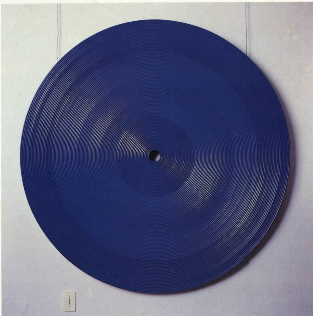
Schwanke Sem título 1989 Plástico, madeira Ø 1.60 x 1.60 m