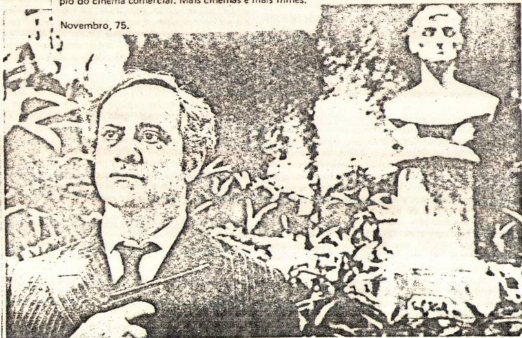
"Terra em Transe", de Glauber Rocha