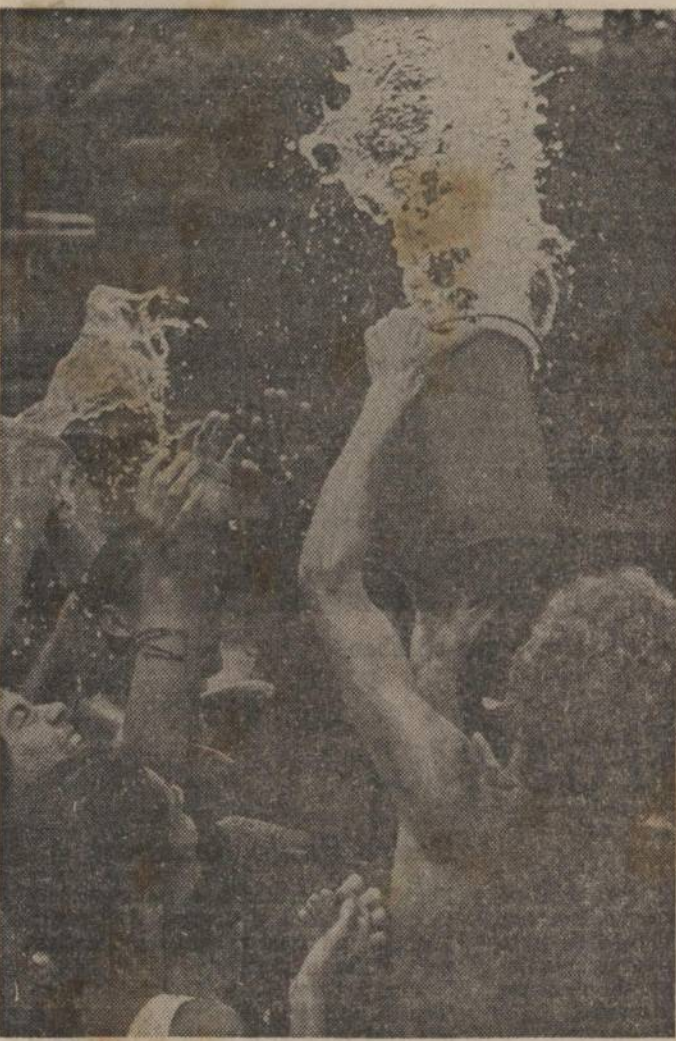
Trabalhando com água no Espaço Lúdico