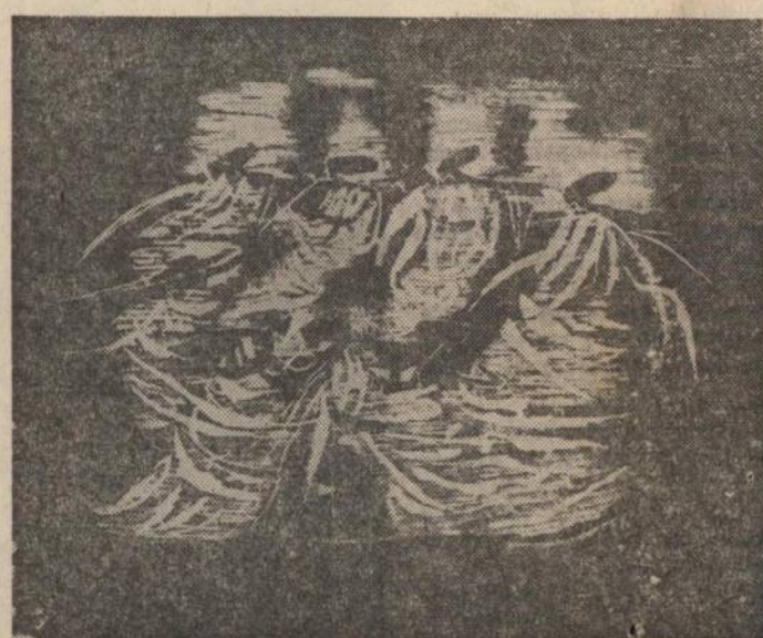
"Festa", série de 1953, xilogravura

Nesta sua retrospectiva, foram reunidos 544 trabalhos, apresentados em dezenas de plaquetas em grosso papelão recortado, coberto por celofane. Em muitas das peças, a ação do tempo, sobretudo devido à má qualidade dos papéis empregados, mereceu da ocasião em que os esboços foram realizados, se faz sentir. A importância da exposição se deve, sobretudo, à raridade com que o artista se apresenta com obras em público, dissendo-se