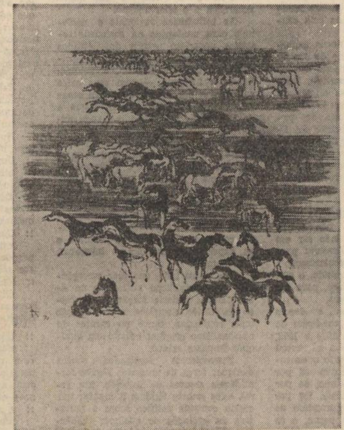
Um dos mais belos conjuntos de cavalos desenhados por Lívio Abramo

Dois anos se passaram até que conseguisse alguns instrumentos apropriados, tentando a seguir, com mais influência sobre o então jovem artista,