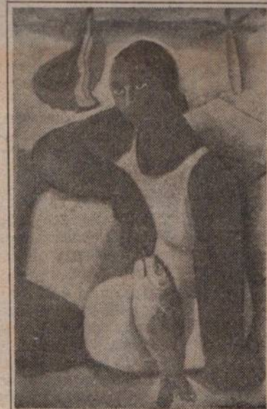
Di Cavalcanti / Figura com Peixe / óleo sobre cartão / 1927

A idéia de reunir alguns trabalhos significativos de Di e Portinari — como está fazendo agora a Galeria Bonino — tinha tudo, portanto, para ser útil e oportuna. A irreverência, a intensidade emotiva, a aparente despreocupação formal, a sensualidade e o predomínio das influências expressionistas e surrealistas, constantes na pintura de Di Cavalcanti, contrapõem-se à seriedade, à frieza, ao controle do gesto criador, ao exercício da razão e ao acordo entre cubismo e expressionismo, que marcaram a parcela maior da obra de Portinari — tanto quanto o combate ardoroso da primeira década modernista se contrapôs à pausa para meditação