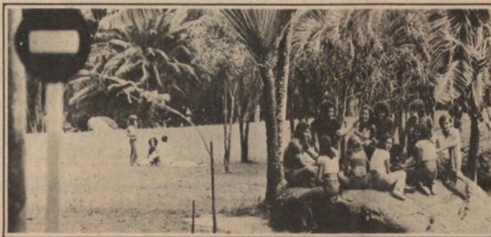
Parque da Cidade

Embora os ecologistas anunciem um déficit de cem mil árvores no Rio, devido a ação destruidora das reservas florestais da cidade, ainda é possível encontrarmos cerca de 16 milhões de metros quadrados de áreas verdes, espremidas entre blocos de concreto. Durante as férias de julho, quando muitos pais