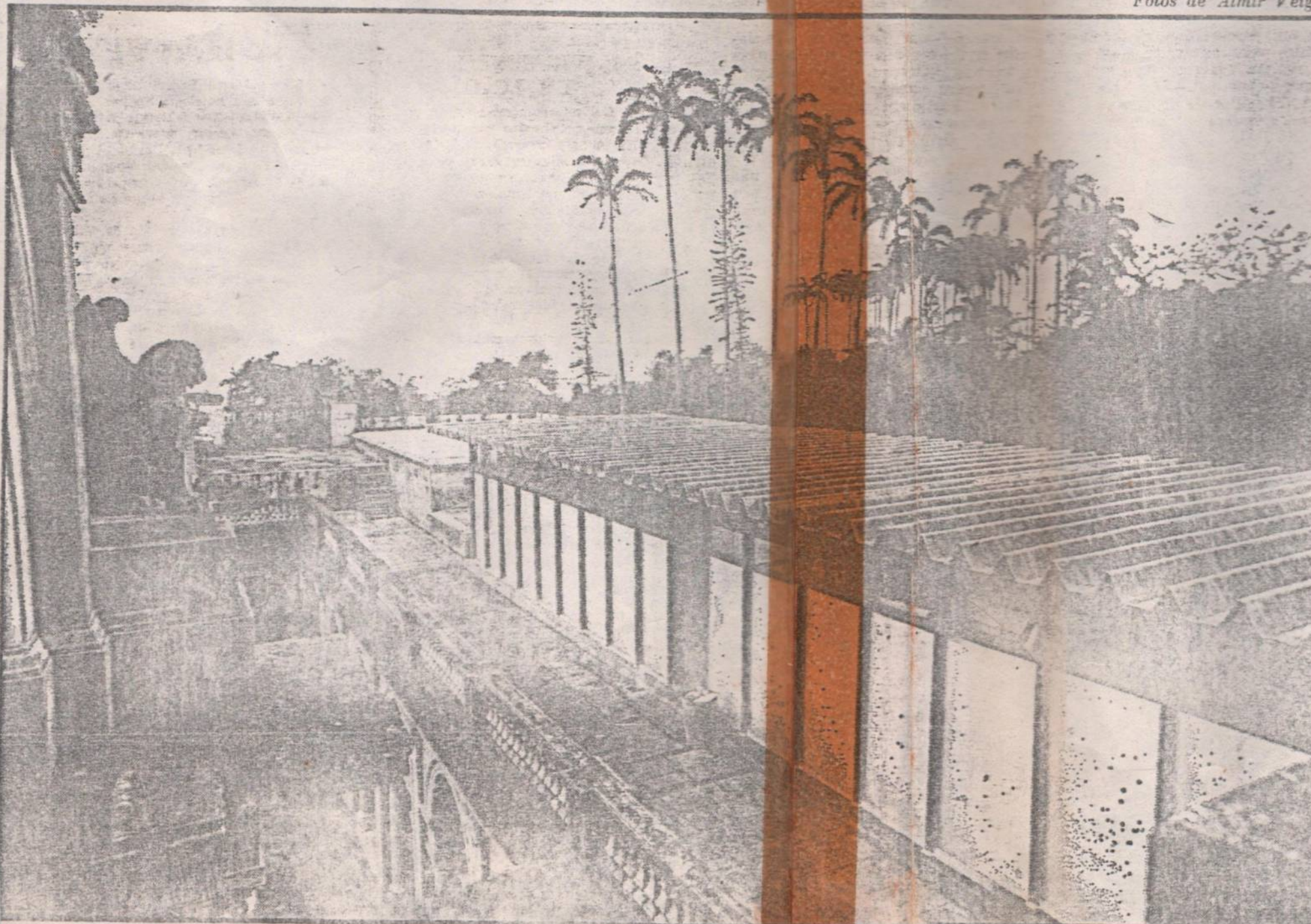
Portinari pintou o painel sobre as saídas do conduto de ar, previamente marcadas, da maneira que nenhum detalhe de sua criação fosse prejudicado