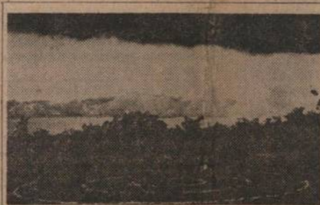
Mario Cravo Neto: Retratando a roda-vida que é Nova Iorque