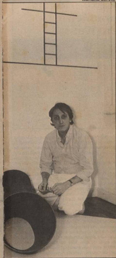
Waltércio Caldas fala no Parque Lage