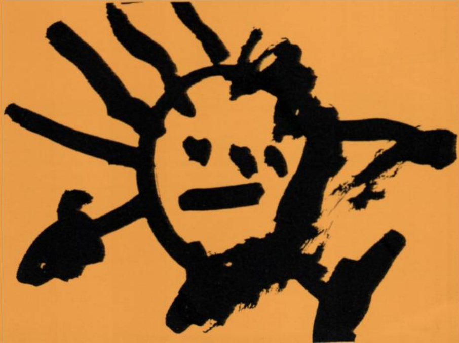
Luisa 3 anos