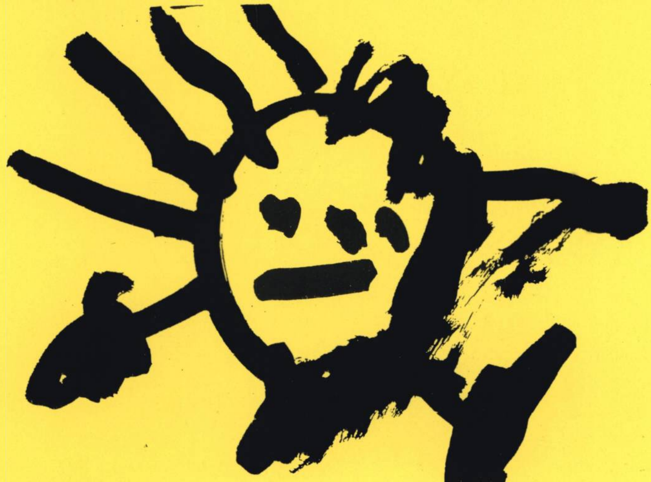
Luisa 3 anos