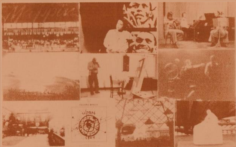
Documentos do Arquivo Multimeios