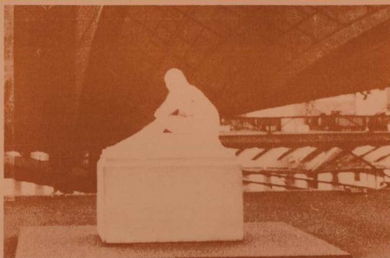
Escultura Eva de Victor Brecheret, acervo CCSP

Entre os principais trabalhos dessa equipe destacam-se, ainda: A Missão de Pesquisas Folclóricas; Música publicitária em São Paulo; Bibliografia da música brasileira 1977-84; O disco em São Paulo.