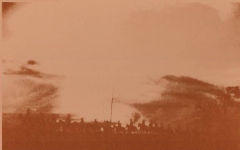
Fotograma do filme O Cangaceiro , de Lima Barreto, 1953

Entre seus principais trabalhos destacam-se: Linguagens experimentais em São Paulo ; Jovens artistas ; Performance ; O Grupo Guanabara ; Situação atual da escultura na cidade de São Paulo ; Coleção Biblioteca de Arte: desenhos, aquarelas e guaches ; Os mestres da fachada ; Anuários das Artes Plásticas .