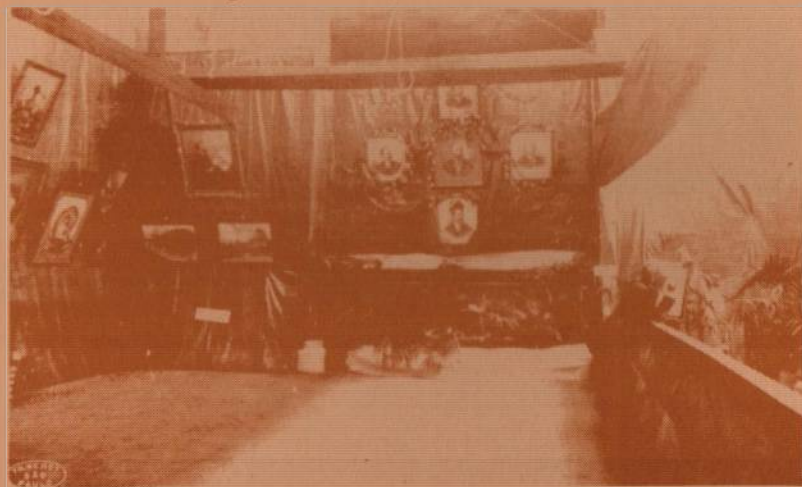
Exposição de Valério Vieira no Progridior

Com base em seu acervo, a equipe tem gerado e participado de exposições, seminários, mostras de vídeo e outros eventos, bem como fornecido subsídios para publicações próprias e de outros especialistas. Entre seus trabalhos destacam-se: O teleteatro paulista nas décadas de 50 e 60 ; O rádio paulista no centenário de Roquette Pinto ; A televisão brasileira ; Perfil da programação do rádio AM em São Paulo ; A história da telenovela ; Audiência de telenovela: uma perspectiva histórica ; TV ano 40 ; Jornais de bairro na cidade de São Paulo ; História da TV Excelsior ; História da TV Record ; Cronologia do rádio paulistano: anos 20 e 30 .