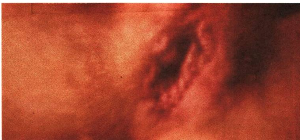
Paula Trope Pandora X, #2 , 1998. Fotografia pinhole , estrutura de madeira, 157 X 284 cm.