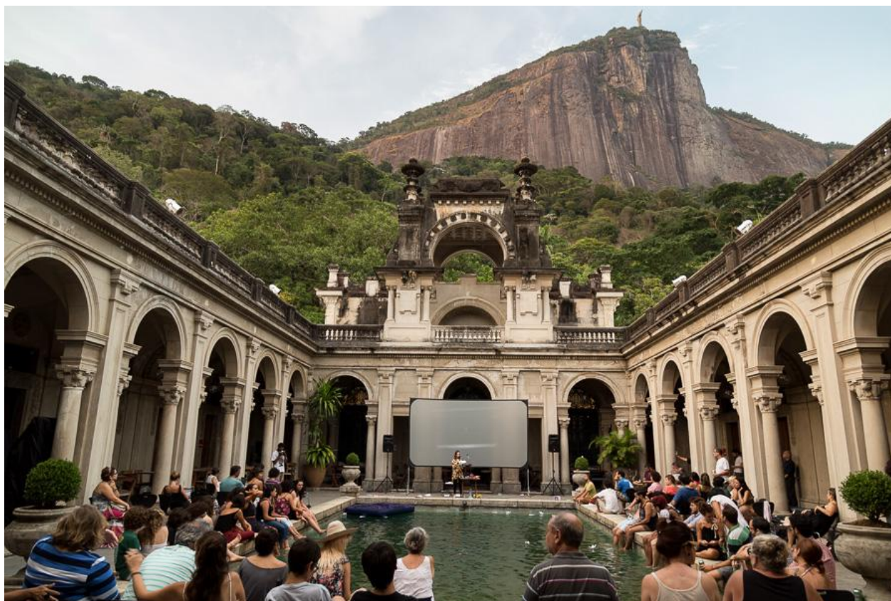
Tertúlia, EAVerão 2015.

Experimentação de formas lúdicas de pensar; a palavra como experiência artística. Nas tertúlias, poetas e escritores se encontram . Aberto ao público.