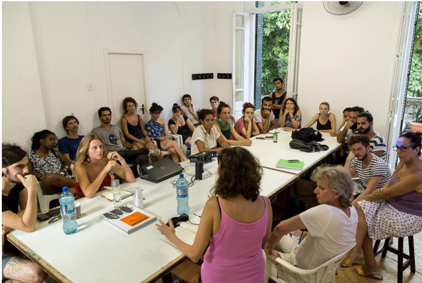
Clínica, EAVerão 2015.

Ação e reflexão na análise crítica da produção dos estudantes.