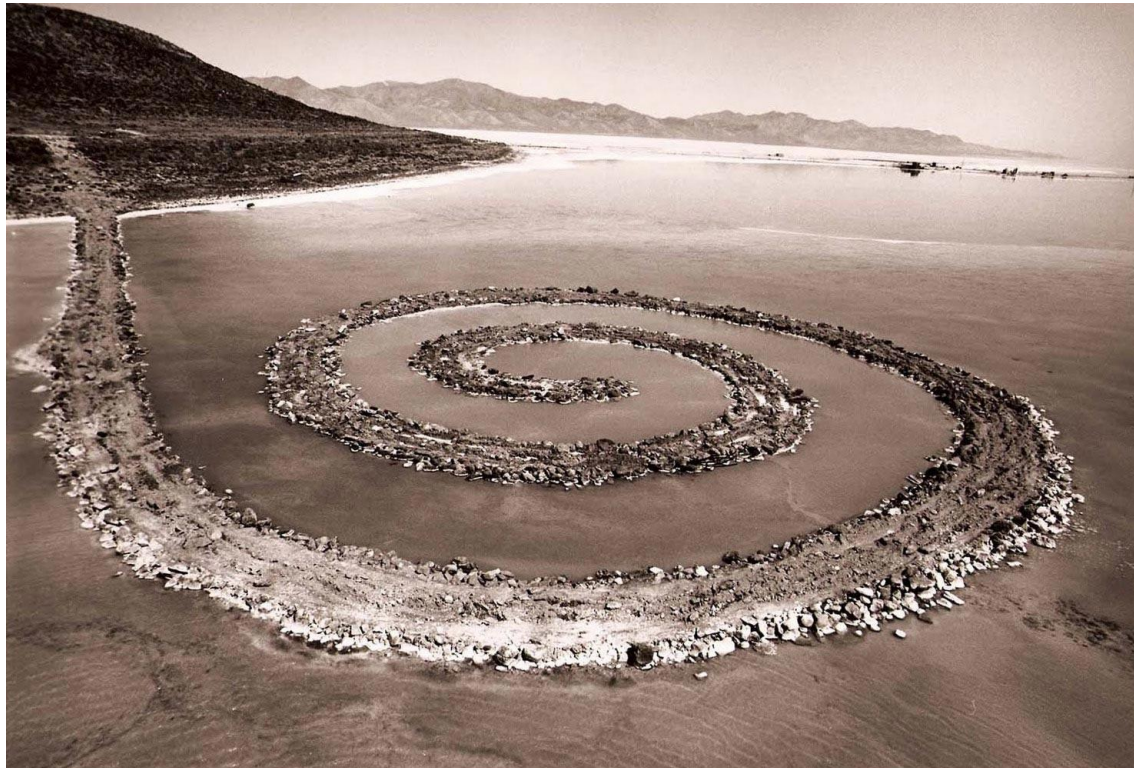
Robert Smithson, Spiral Jetty , 1970.

Partindo dessa frase dita por Robert Smithson na década de 1970 sobre a construção da obra Spiral Jetty , a oficina propõe inverter o nosso sentido de intervenção no espaço, relacionado às instalações, land art e práticas site-specific, buscando localizar uma voz do ambiente que redefina a nossa ação, ou ausência dela.