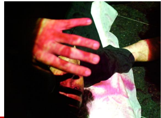
O golpe do corte, 2005.