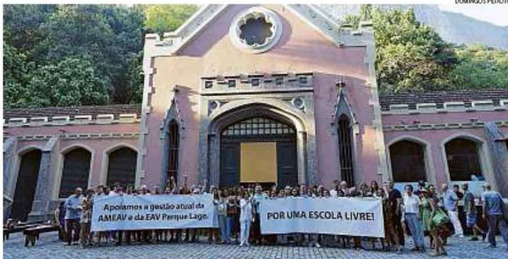
Desagravo. Artistas, curadores e professores defenderam o atual diretor da escola, afastado na última quinta-feira

Abaixo-assinado será encaminhado para Ruan Lira, secretário de Cultura