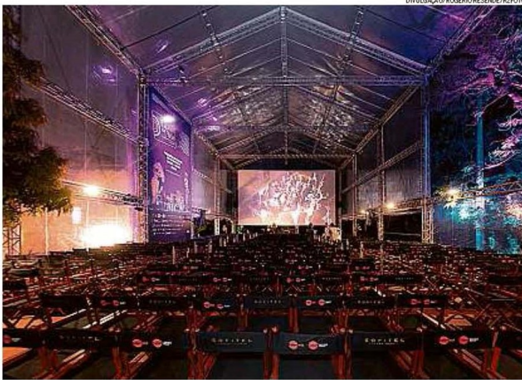
Entre as árvores. Espaço criado para o Festival Ópera na Tela, no Parque Lage: programação vai até o dia 12