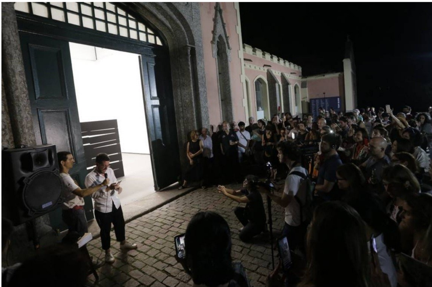
Curador da EAV , Ulisses Carrilho lê carta escrita por Fabio Szwarcwald em agradecimento ao apoio