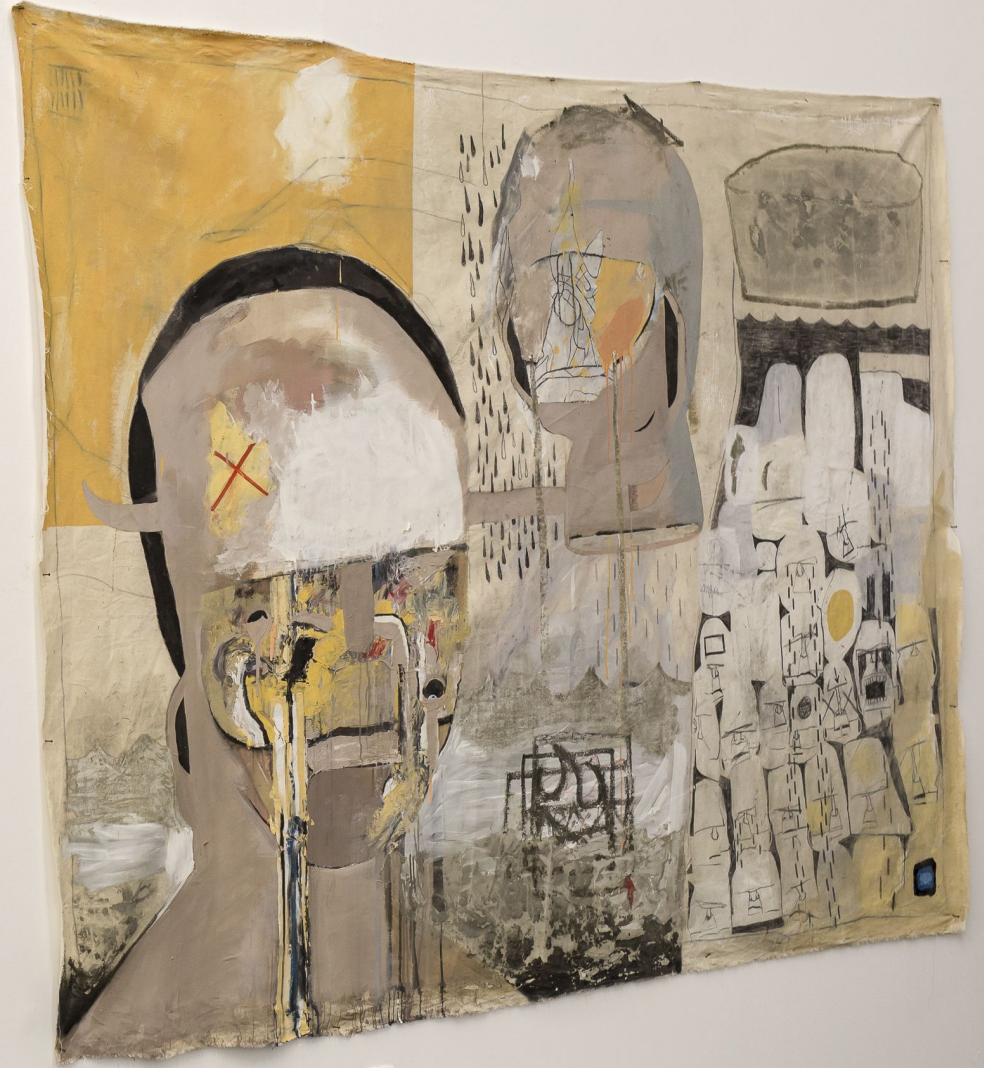
Small white label with illegible text.