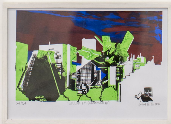
HERBERT DE PAZ Terror em Guanabara, 2016 Linha de montagem 28,7 x 40cm