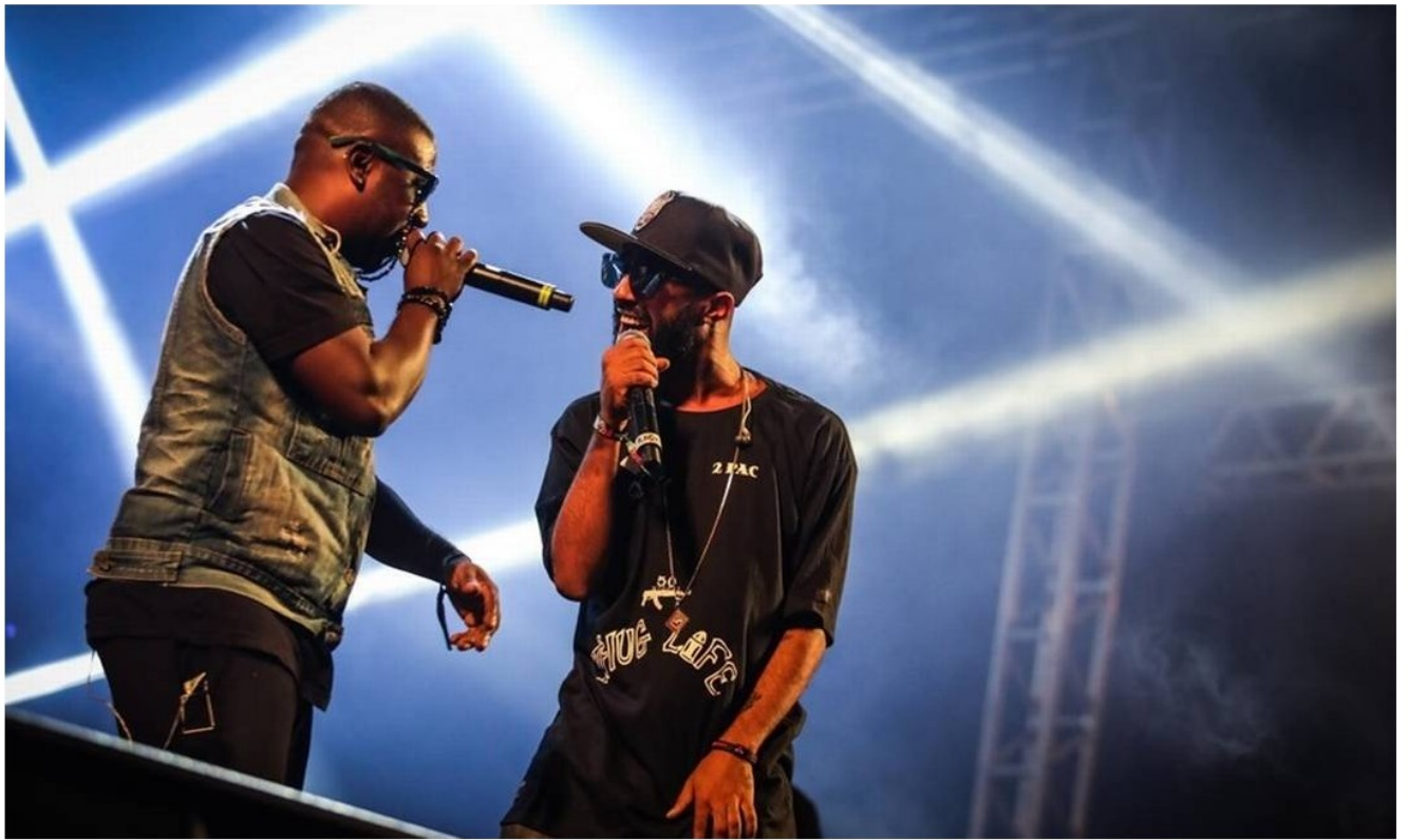
Os baianos do ÁTTØØXXÁ