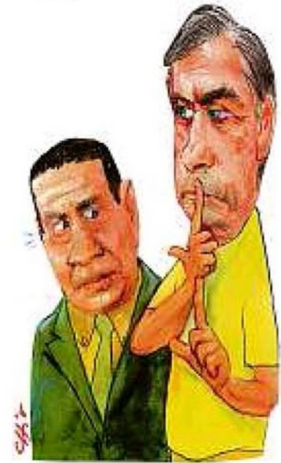
— Só eu? E os meninos?