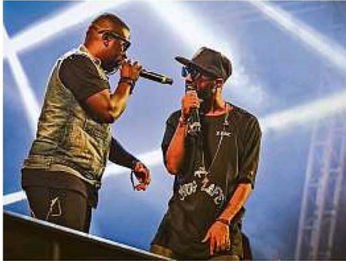
Banda baiana ATTØØXXÁ (foto) e Rincón Sapiência tocam domingo

BRUNO CALIXTO bruno.calixto@oglobo.com.br