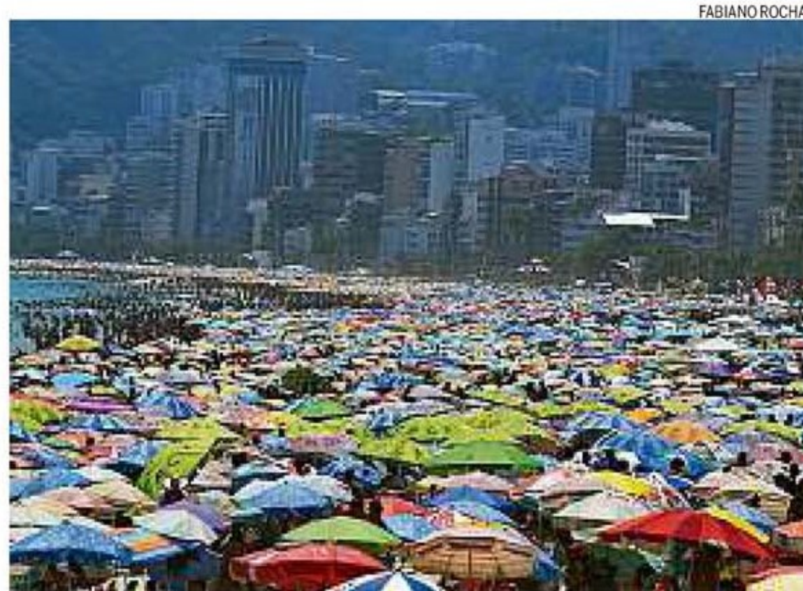
Mar de barracas. Ipanema lotada de banhistas na prévia do que será o verão

Projeto de alunos de Oceanografia da Uerj, o Stand UPET animou a