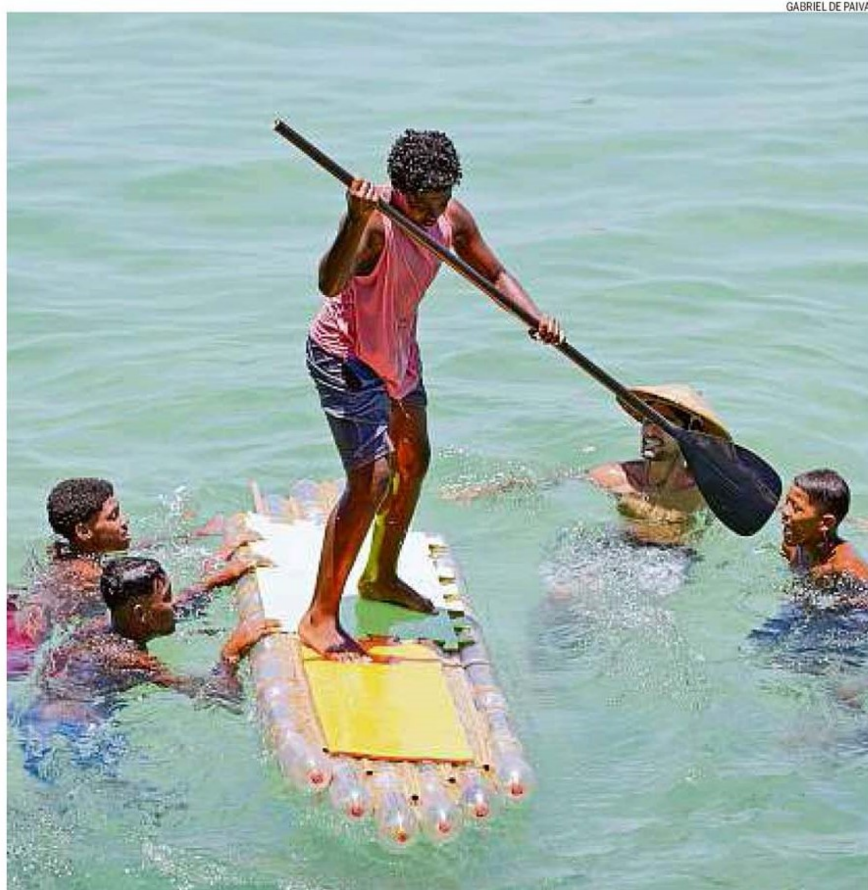
Criatividade. Jovens brincam com a prancha de stand up paddle feita de PET por alunos da Uerj; ideia que veio do Sul