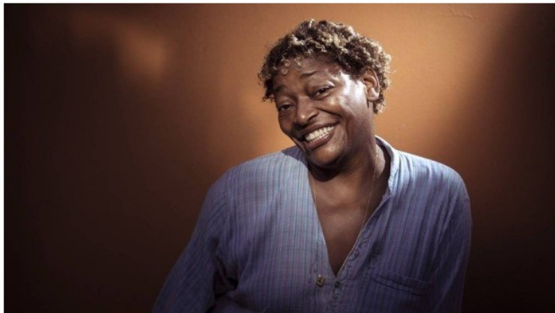
A cantora Mart'nália faz show de graça no Espaço Furnas Cultural

Arena Carioca Carlos Roberto De Oliveira (Dicró): Rua Flora Lobo 184, Penha Circular — 98179-1756. Dom, às 15h. 70 minutos. Livre.