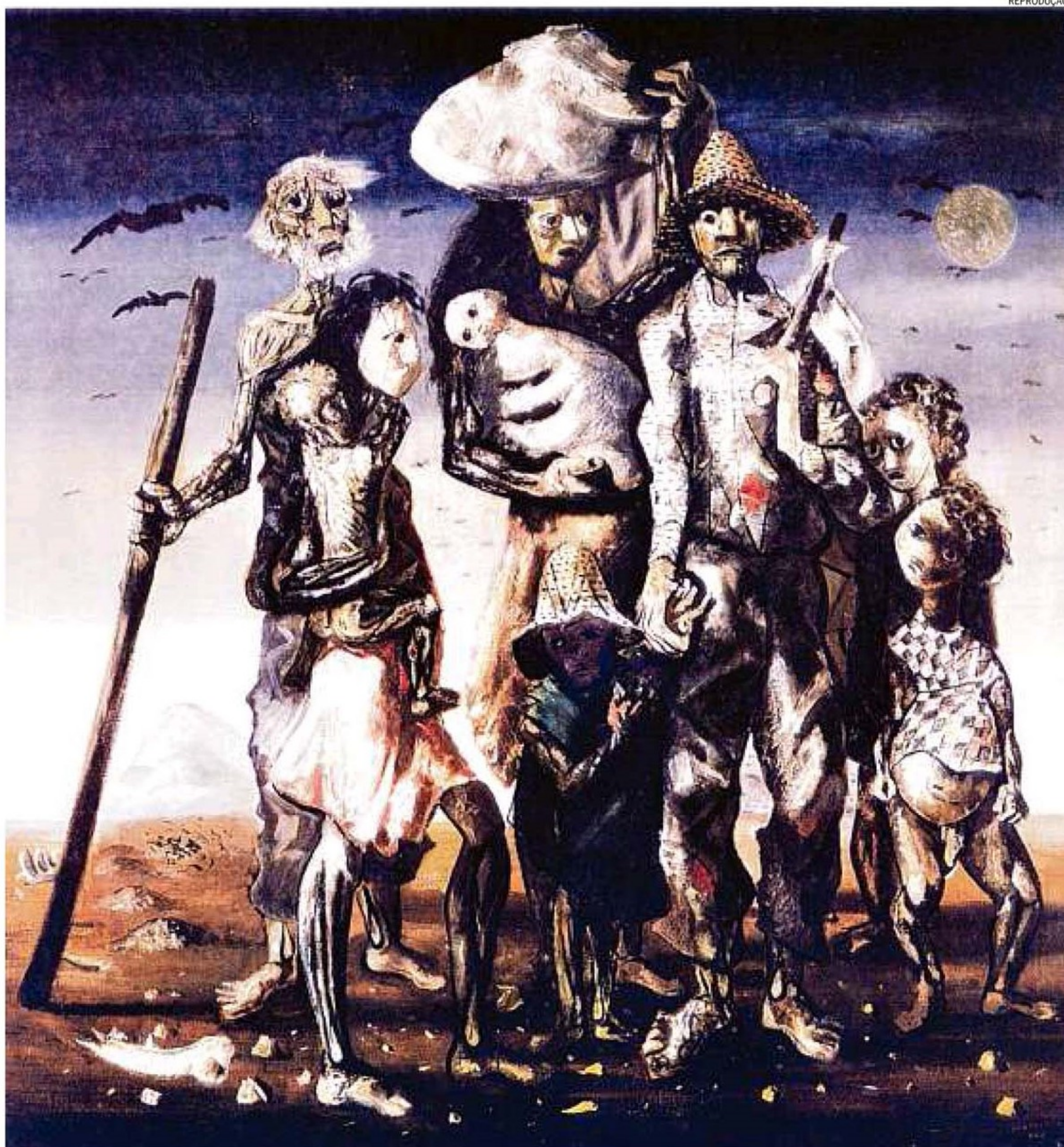
Mecenato. O Masp vai restaurar em 2019 a tela "Retirantes" (1944), de Cândido Portinari, com os recursos obtidos de doadores individuais, via Lei Rouanet

(Estagiária, sob a supervisão de Nani Rubin)