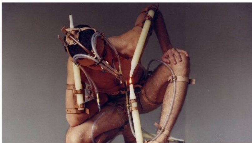
"Transferência2", de Michel Groisman, performance de 1999, apresentada na EAV

A ideia é que o artista consiga realizar em 2019 a obra "Risco#32", premiada pelo programa Rumos 2018 do Itaú Cultural. Trata-se de uma máquina de grande dimensões para ser manipulada por 32 pessoas simultaneamente, com o propósito de fazerem juntas um simples desenho num papel.