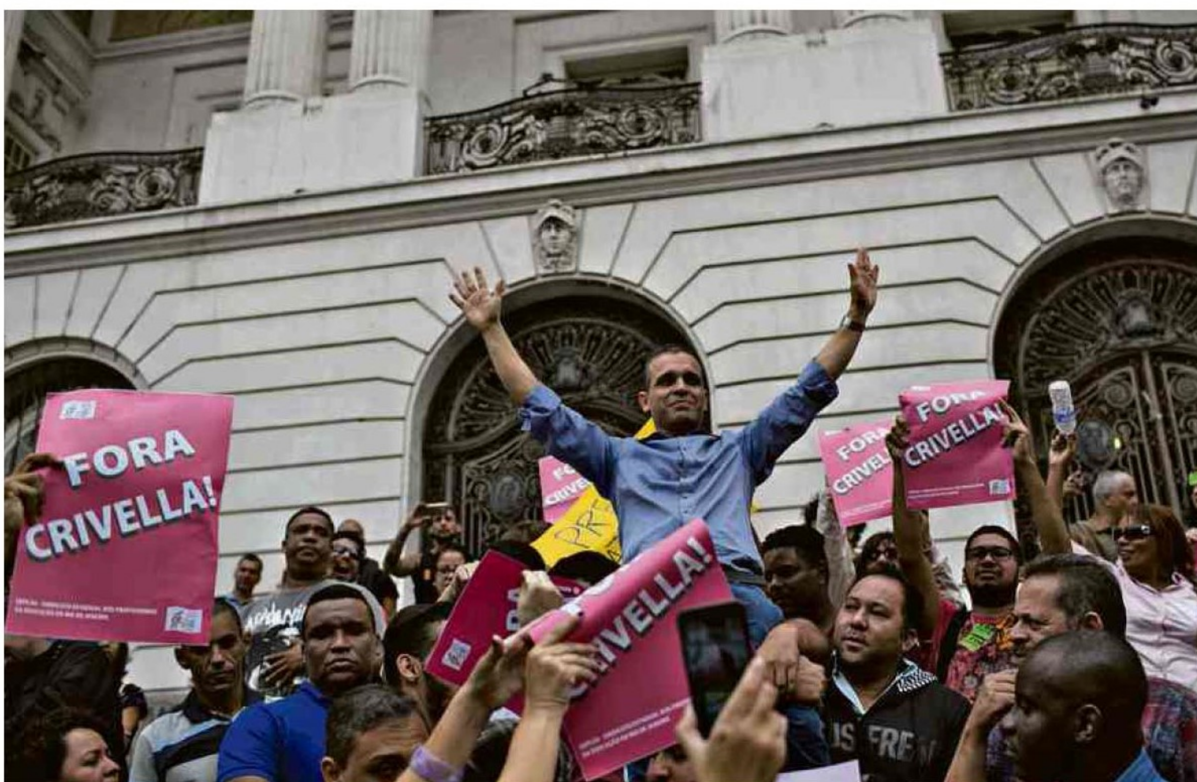
Evangélicos e adversários do prefeito Marcelo Crivella dividem espaço em frente à Prefeitura do Rio