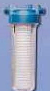
AquaShine p/ máquina de lavar