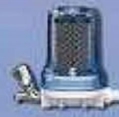
Bella Fonte p/ ponto de parede