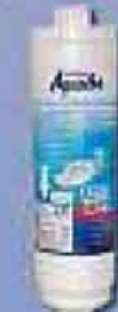
AP 717B p/ geladeira