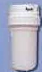
AP200F Vários utilidades