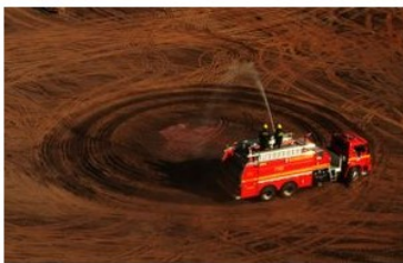
Exposição na Escola de Artes Visuais do Parque Lage

"Cordel e cantadores - Brasil, a República do Cordel", em cartaz até 17/8 no Sesc Tijuca (R. Barão de Mesquita, 539 - Tijuca; Tel.: 3238- 2139) homenageia os cem anos de morte do poeta Leandro Gomes de Barros (1865-1918), considerado um dos patronos da literatura de cordel. A exposição apresenta uma coleção com cordéis de Gomes de Barros e outra de cordéis comemorativos do Centenário de Juazeiro do Norte. Estampas obtidas através da xilogravura para capas e ilustrações e xilogravuras em alto relevo também estão entre os destaques da exposição. Ter. a sex., das 9h às 21h, e sáb. e dom. das 9h30 às 17h30