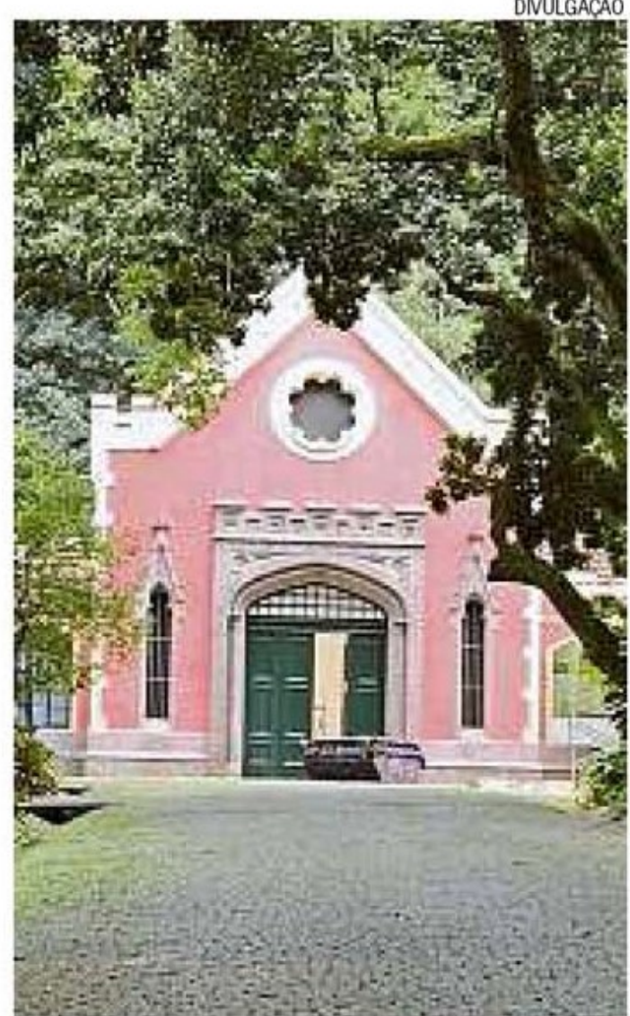
Tom rosado. Uma das construções reformadas

Depois de pouco mais de um mês de obras, as cavaliças do Parque Lage, no Jardim Botânico, estão com fachadas impecáveis. As construções históricas foram restauradas e voltaram a ter pintura em tom rosado, com detalhes em bege. Como O GLOBO informou, a reforma foi possível por causa do sucesso de um financiamento coletivo para trazer à cidade a exposição "Queermuseu: Cartografias da diferença na arte brasileira", que, depois de ser censurada em Porto Alegre, não pode ocupar o Museu de Arte do Rio por conta de um veto do prefeito Marcelo Crivella.