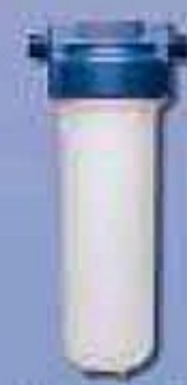
AquaTotal p/ ponto de entrada