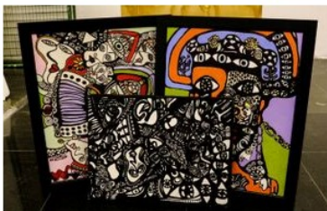
'Cordel e cantadores' fica em cartaz até 17/8

Clique aqui para ler a notícia direto da fonte