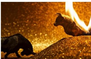
Exposição 'Cotidiano'