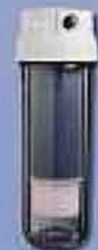
AP230F Vários utilidades