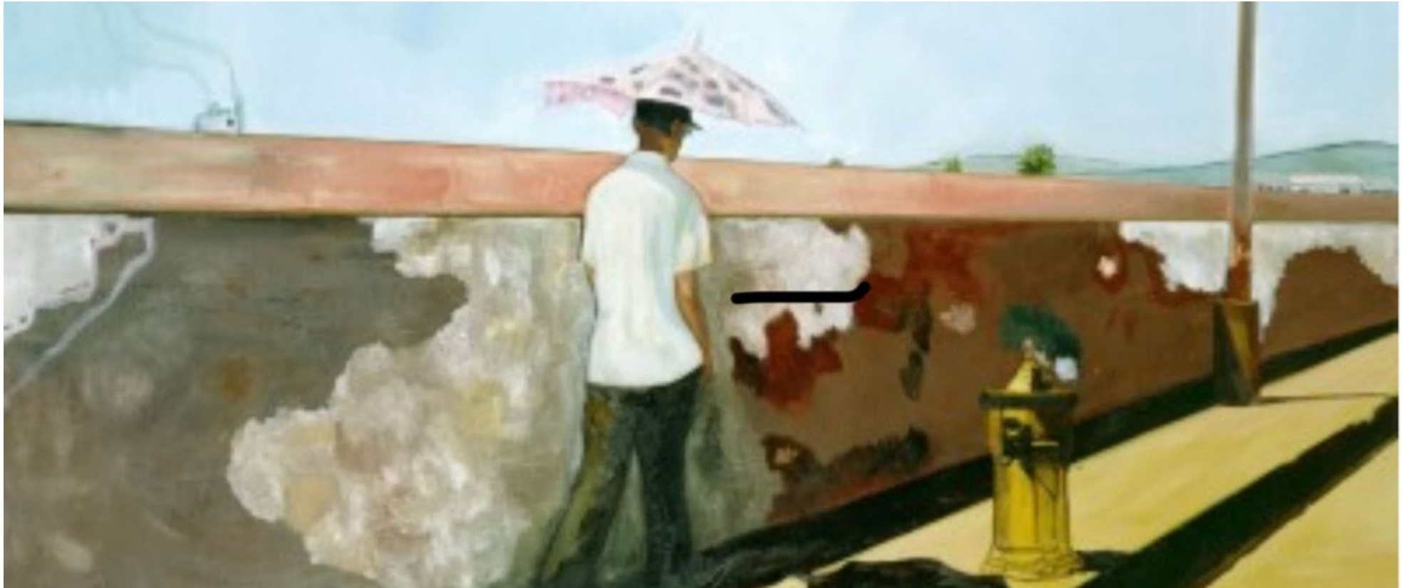
Peter Doig. Lapeyhouse, 2004.