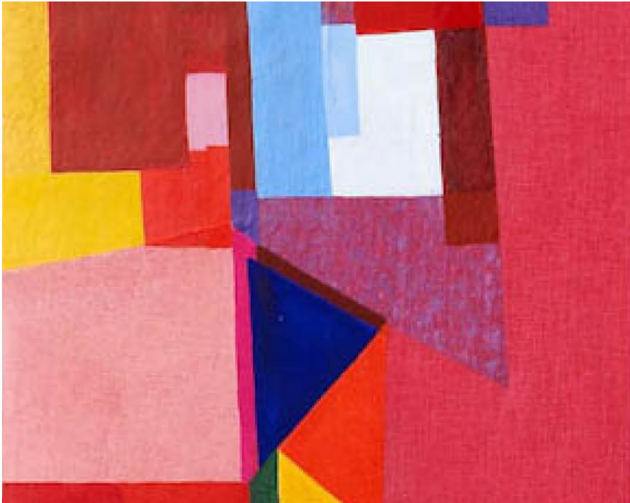
IMAGEM: DO DESENHO AOS OUTROS MEIOS