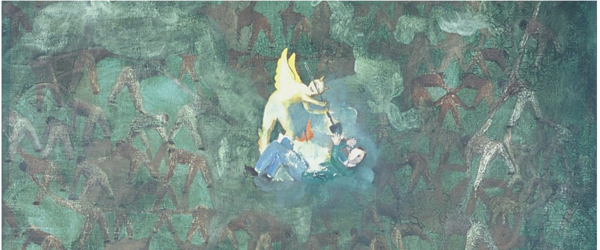
Chico Cunha. O inferno do artista, 2001.